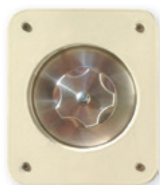
▲ MANOPOLA INTERNA DI SICUREZZA (VISTA DALLA CABINA) INTERNAL SECURITY KNOB (FROM CABIN)