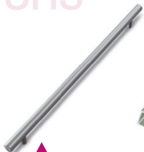
▲ MANIGLIA A TUBO IN ACCIAIO INOX 20X550 MM STAINLESS STEEL TUBE 20X550MM