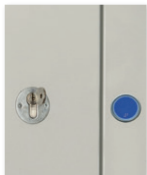
▲ SERRATURA DI SICUREZZA (VISTA DAL PIANO) ADDITIONAL SAFETY LOCK (FROM LANDING)