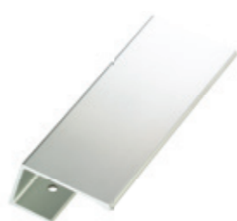
▲ MANIGLIA BASIC IN ALLUMINIO ANODIZZATO ANODIZED ALUMINUM BASIC HANDLE