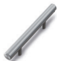
▲ MANIGLIA A TUBO IN ALLUMINIO ANODIZZATO ANODIZED ALUMINUM TUBE