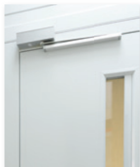
▲ CHIUDIPIORTA ESTERNO EXTERNAL DOOR CLOSER