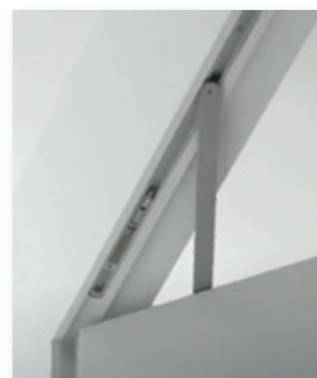
▲ CHIUDIPIORTA INCASSATO EMBEDDED DOOR CLOSER