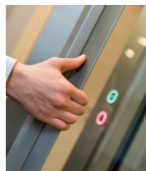
▲ MANIGLIA A SCOMPARSA FLUSH HANDLE