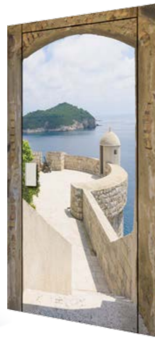
SUBLIMA CON IMMAGINE SUBLIMATA WITH SUBLIMATED IMAGE