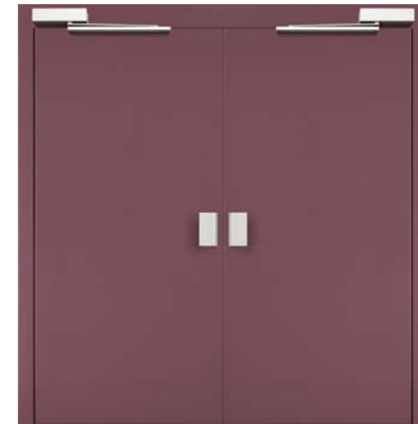
CAMILLA CON MANIGLIE IN ALLUMINIO WITH ALUMINIUM HANDLES