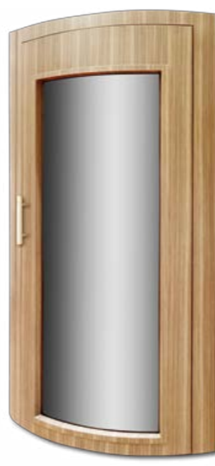
GIOTTO SUBLIMATA LEGNO SUBLIMATED WOOD