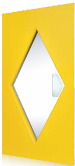
KATE CON MANIGLIA IN CRISTALLO WITH GLASS HANDLE