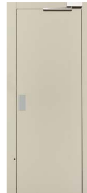
SOPHIA CON MANIGLIA IN ALLUMINIO WITH ALUMINIUM HANDLE