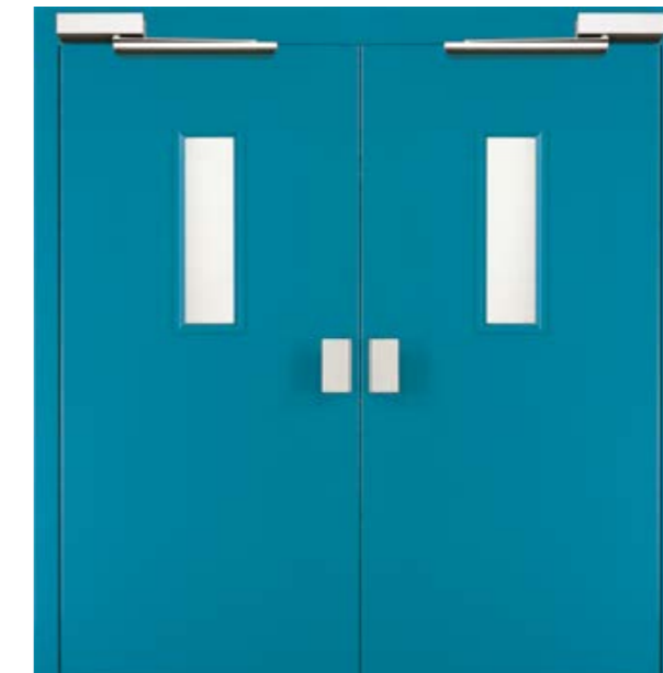
LAURA CON MANIGLIE IN ALLUMINIO E FINESTRE WITH ALUMINIUM HANDLES AND WINDOWS