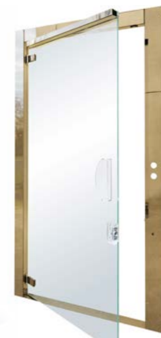
KRYSTAL IN CRISTALLO E INOX BRONZO FULL GLASS AND STAINLESS STEEL BRONZE