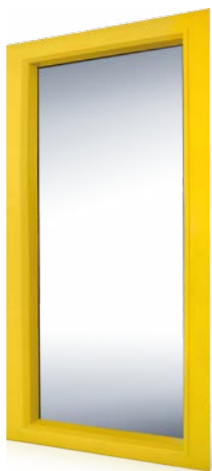
GRETA PORTA PANORAMICA PANORAMIC DOOR